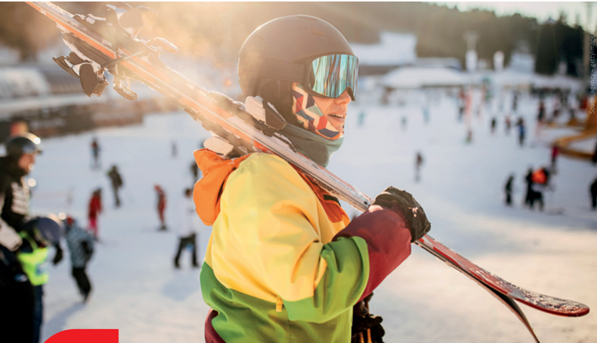
Sportliche Aktivität steht u. a. mit besserer Denkfähigkeit in Zusammenhang.