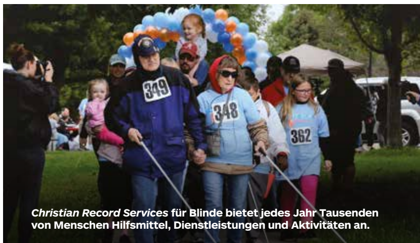
Christian Record Services für Blinde bietet jedes Jahr Tausenden von Menschen Hilfsmittel, Dienstleistungen und Aktivitäten an.

1967 wurde das National Camps for Blind Children [Nationale Ferienlager für blinde Kinder] gegründet. Im ersten Sommer fand das Zeltlager in Florida statt, und 23 Jugendliche nahmen daran teil. Seitdem hat diese Missionsinitiative fast 50.000 vertrauensbildende Erlebnisse in der Natur durch spezielle Campmeetings ermöglicht. ©