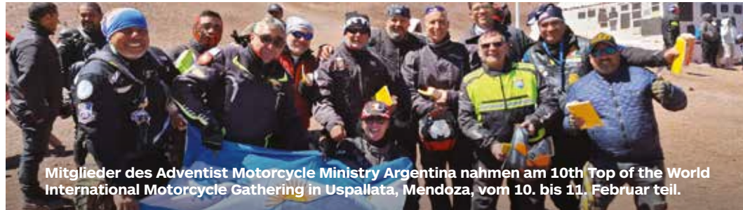
Mitglieder des Adventist Motorcycle Ministry Argentina nahmen am 10th Top of the World International Motorcycle Gathering in Uspallata, Mendoza, vom 10. bis 11. Februar teil.

Mitglieder des AMM Argentina sagten, dass ihnen eine biblische Geschichte in