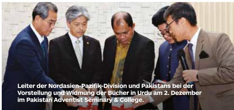
Leiter der Nordasien-Pazifik-Division und Pakistans bei der Vorstellung und Widmung der Bücher in Urdu am 2. Dezember im Pakistan Adventist Seminary & College.

Pakistan, eine überwiegend muslimische Nation im Nordwesten des indischen Subkontinents, erlangte 1947 die Unabhängigkeit von der britischen Herrschaft. Der Staat war zunächst in Ost- und Westpakistan geteilt. Im Jahr 1971 wurde Ostpakistan als Bangladesch unabhängig, während Westpakistan das heutige Pakistan bildete. Mit 240 Millionen Einwohnern ist es das fünftbevölkerungsreichste Land der Welt. Statistiken zufolge sind fast 97 Prozent der Bevölkerung Muslime, so dass die Christen eine kleine Minderheit darstellen, von denen weniger als 20.000 getaufte Adventisten sind. ©