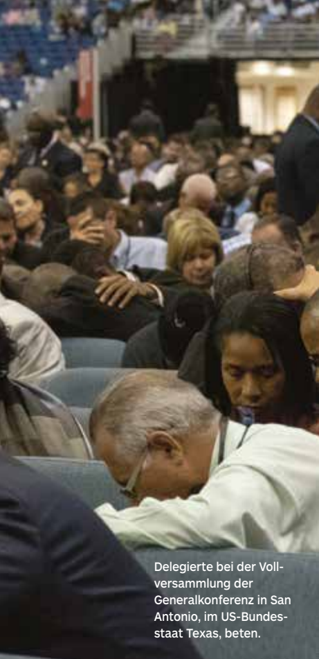
Delegierte bei der Vollversammlung der Generalkonferenz in San Antonio, im US-Bundesstaat Texas, beten.