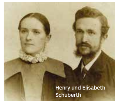
Ellen G. White Estate

Nun könnte man meinen, dass ich Schwester White nach Australien