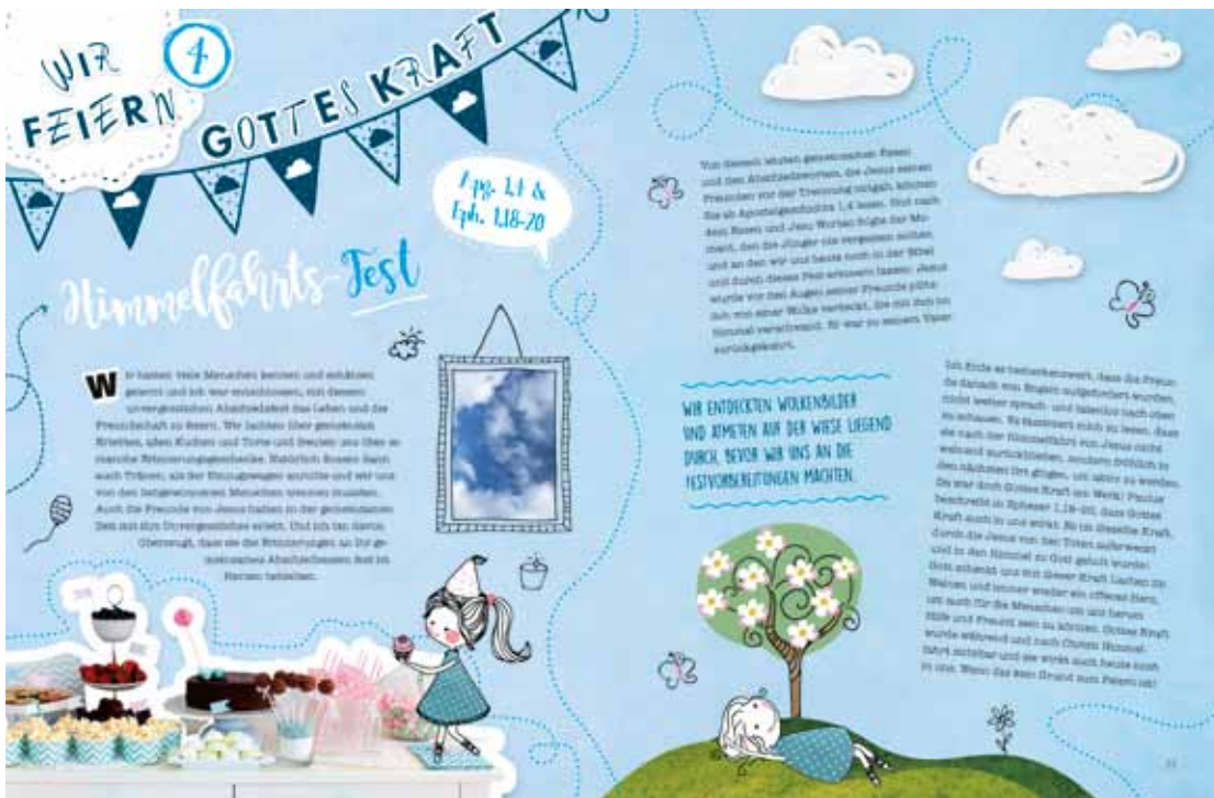
Ein Blick ins Innere des Buches.

Aufforderung Gottes erhielten, dieses eine besondere Fest der anstehenden Befreiung zu feiern, da konnten auch sie nicht alle Facetten und Symbole begreifen, die Gott ihnen damit schenken wollte. Fest für Fest waren sie dennoch dazu eingeladen, Gott näher kennenzulernen und seine Liebe für uns Menschen zu entdecken.