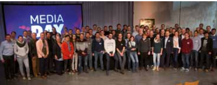
Gut 100 Medienschaffende aus Deutschland, Österreich und der Schweiz nahmen am Media Day teil.

Eindrücke vom 6. Media Day bei der STIMME DER HOFFNUNG